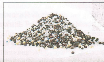
TC Arbor gibt es als Granulat.